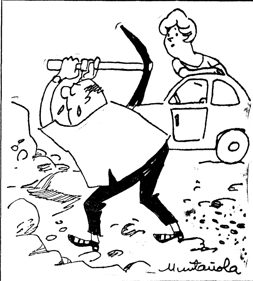
—La iniciativa privada no quiere decir que tú te pongas a hacer una autopista, querido...